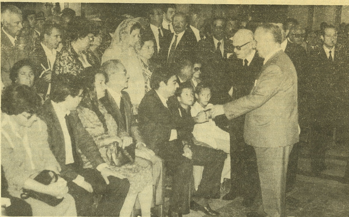
Il cordoglio di Sandro Pertini ai familiari delle vittime. Prima di entrare nel Duomo, il Presidente ha dichiarato: "Niente leggi eccezionali, solo coraggio"